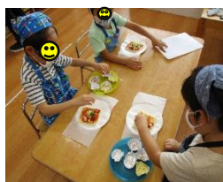
みんなで育てた ピーマン・トマトを使ってピザを作ったよ。おいしくできたよ。