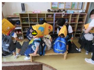
おうちの人が来るまでおこりに待たたよ