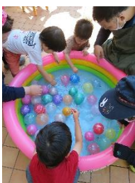
むずかしかったよ～